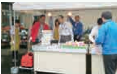
発電機を使用し仮設店舗を設置する訓練