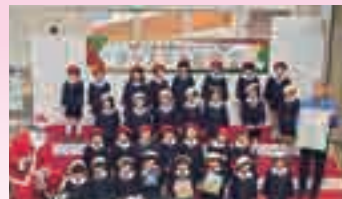
メグリア本店での贈呈式の様子