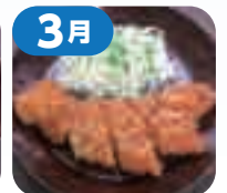
まるごと棒ヒレカツ和風おろしソース