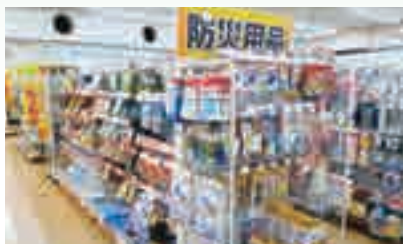
メグリア本店の防災用品コーナー

災害発生に備え、発災時に行政・地域の皆さまと連携・協力し、地域に必要な支援を通じてお役立ちできるよう、準備・計画策定を進めてまいります。