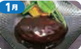
シェフの拘りハンバーグ