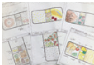
生徒のアイデアイメージ図